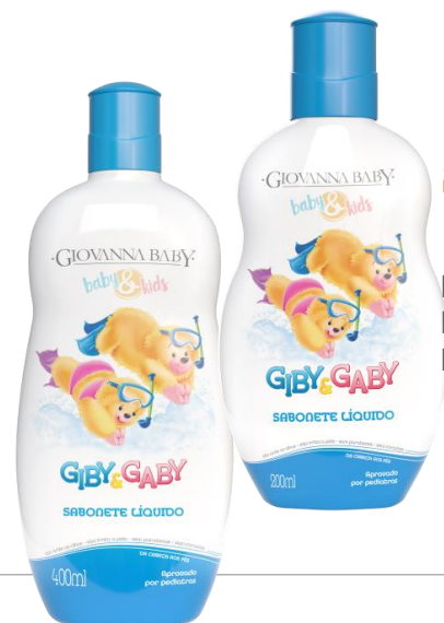
Sabonete Liq. 200ml