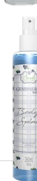
BLUEBERRY Cód. 19368 EAN DUN FAB.