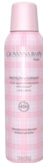
CLASSIC Cód. 19321 EAN 7896044936923 DUN 17896044936920 FAB. 051220020