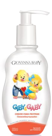
Creme Pentear 200ml