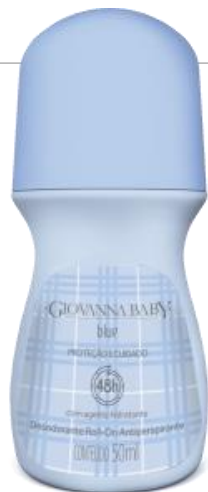
BLUE Cód. 19331 EAN DUN FAB.