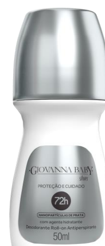
SILVER Cód. 20493 EAN DUN FAB.