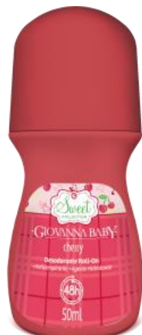
CHERRY Cód. 19334 EAN DUN FAB.