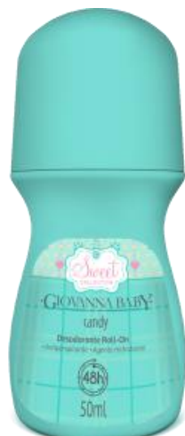
CANDY Cód. 19333 EAN DUN FAB.