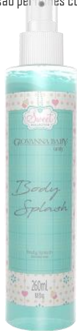
CANDY Cód. 19371 EAN DUN FAB.