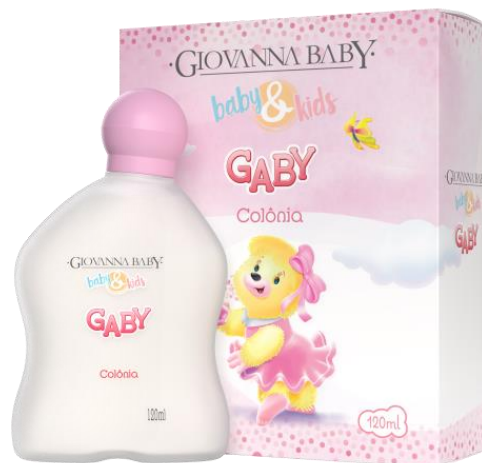
BABY & KIDS GIBY & GABY COLONIA UNISEX 120 ML