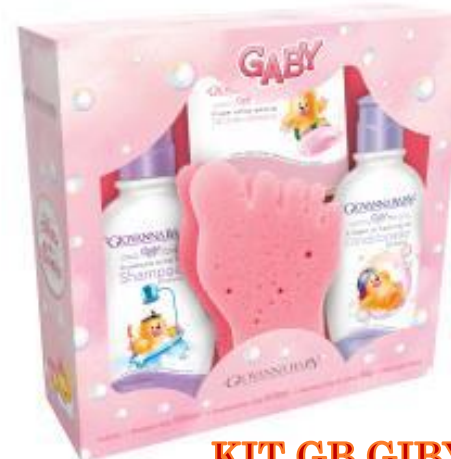
KIT GB GIBY SH/COND +SAB.+ESP ROSA

EAN 7896044956365 DUN 17896044956362 FAB. 051320040