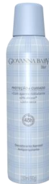
BLUE Cód. 19322 EAN 7896044936916 DUN 17896044936913 FAB. 052220030