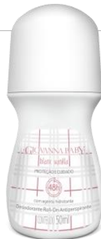
BLANC VANILA Cód. 19332 EAN DUN FAB.