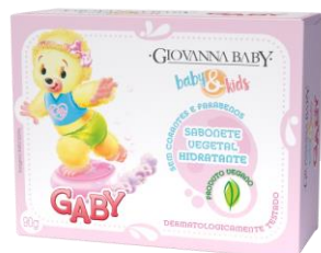
B&K SABONETE VEGETAL RETANGULAR GABY 90G