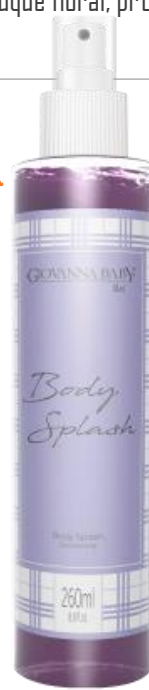
LILAC Cód. 21942 EAN DUN FAB.