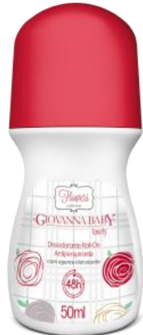
LOVELY Cód. 21951 EAN DUN FAB.