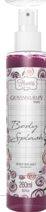
BEAUTY Cód. 19372 EAN DUN FAB.