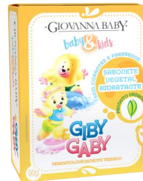
SAB GB GIBY BARRA UNISSEX 90gr

EAN 7896044956402 DUN 17896044956409 FAB. 051210040