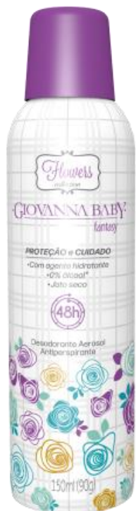
FANTASY Cód. 21948

As memórias olfativas conquistadas pelas nossas colônias se refletem na preferência dos consumidores pelos desodorantes aerossóis, nossos campeões de vendas.