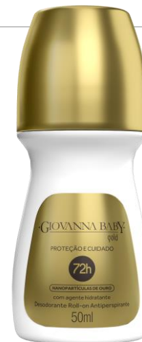
GOLD Cód. 20492 EAN DUN FAB.