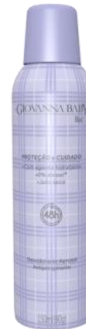
LILAC Cód. 21939 EAN 7896044942009 DUN 17896044942006 FAB. 052321130