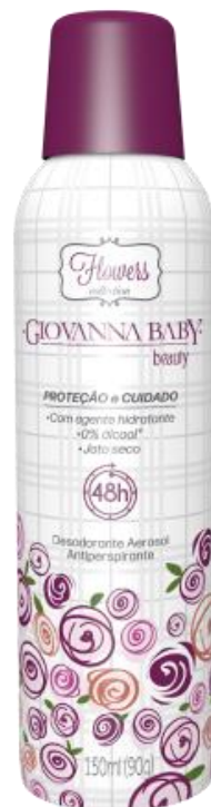
BEAUTY Cód. 19327