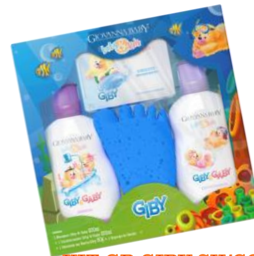
KIT GB GIBY SH/COND +SAB.+ESP AZUL