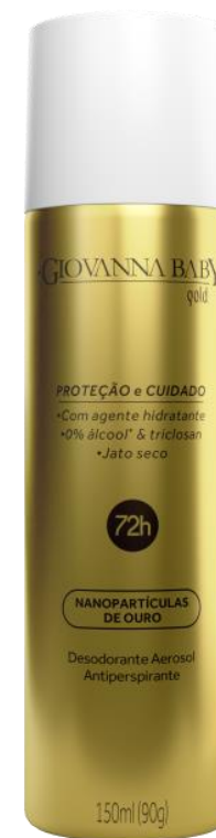
GOLD Cód. 20862