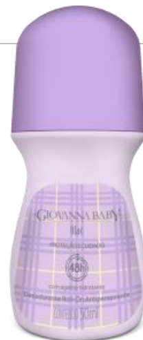
LILAC Cód. 21940 EAN DUN FAB.