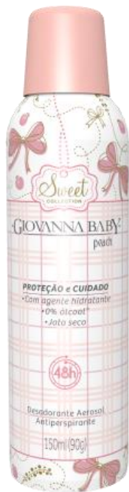
PEACH Cód. 21945