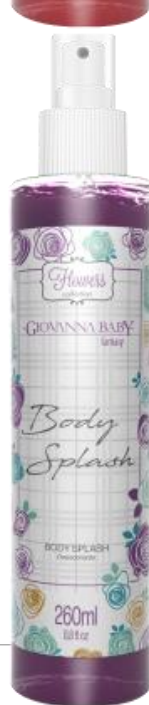
FANTASY Cód. 21541 EAN DUN FAB.