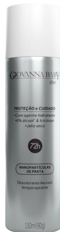
SILVER Cód. 20863