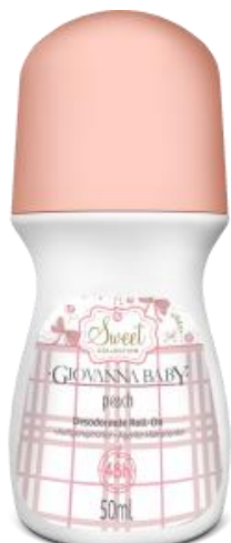
PEACH Cód. 21946 EAN DUN FAB.