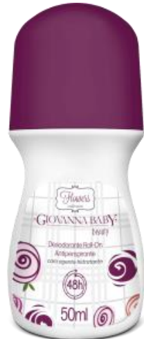
BEAUTY Cód. 19336 EAN DUN FAB.