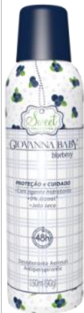
BLUEBERRY Cód. 19326 EAN 7896044996804 DUN 17896044996801 FAB. 057400108