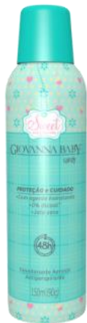
CANDY(doce) Cód. 19324 EAN 7896044953562 DUN 17896044953569 FAB. 055100010