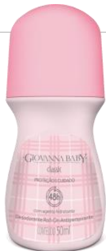
CLASSIC Cód. 19329 EAN DUN FAB.