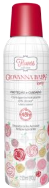
LOVELY Cód. 21156 EAN 7896044960072 DUN 17896044960079 FAB. 057100040