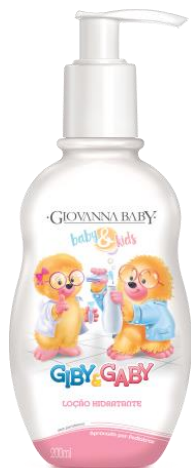
Loção Hid. 200ml

EAN 7896044997733 DUN 17896044997730 FAB. 057400162