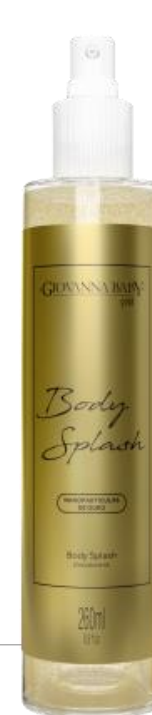
GOLD Cód. 20494 EAN DUN FAB.