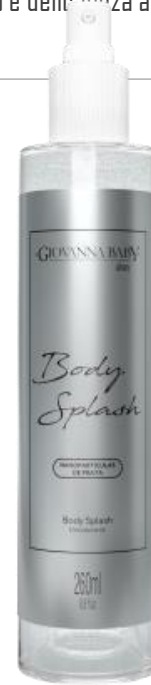
SILVER Cód. 20495 EAN DUN FAB.