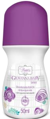
FANTASY Cód. 21949 EAN DUN FAB.