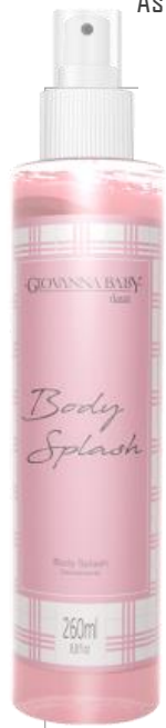
Classic Cód. 19365 EAN DUN FAB.