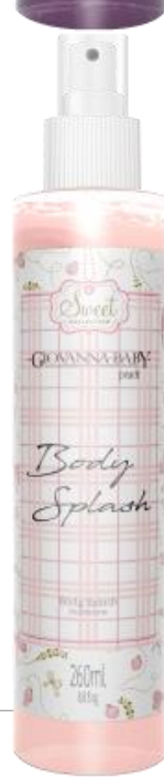
PEACH Cód. 21947 EAN DUN FAB.