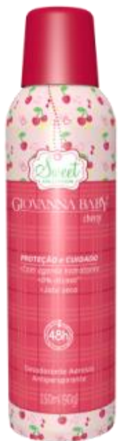
CHERRY(cereja) Cód. 19325 EAN 7896044952794 DUN 17896044952791 FAB. 053100010