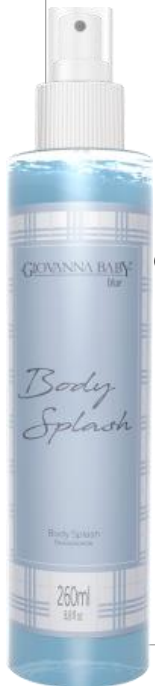
BLUE Cód. 19366 EAN DUN FAB.