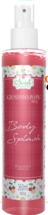
CHERRY Cód. 19370 EAN DUN FAB.