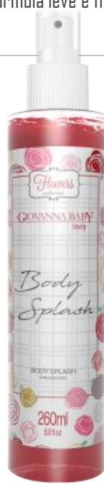
LOVELY Cód. 21953 EAN DUN FAB.