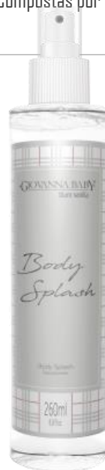
BLAU VANILA Cód. 19367 EAN DUN FAB.