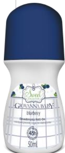
BLUEBERRY Cód. 19335 EAN DUN FAB.