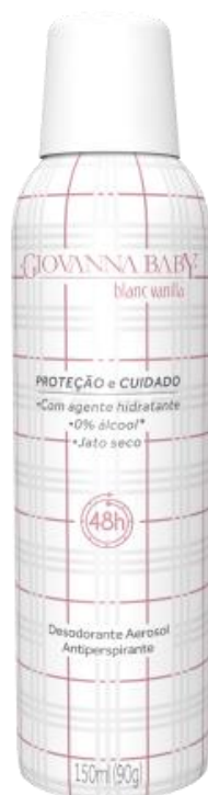
BLANC VANILA Cód. 19323