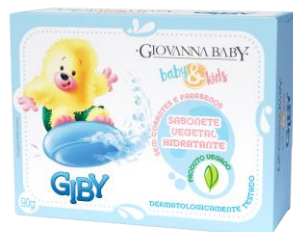
B&K SABONETE VEGETAL RETANGULAR GIBY 90G